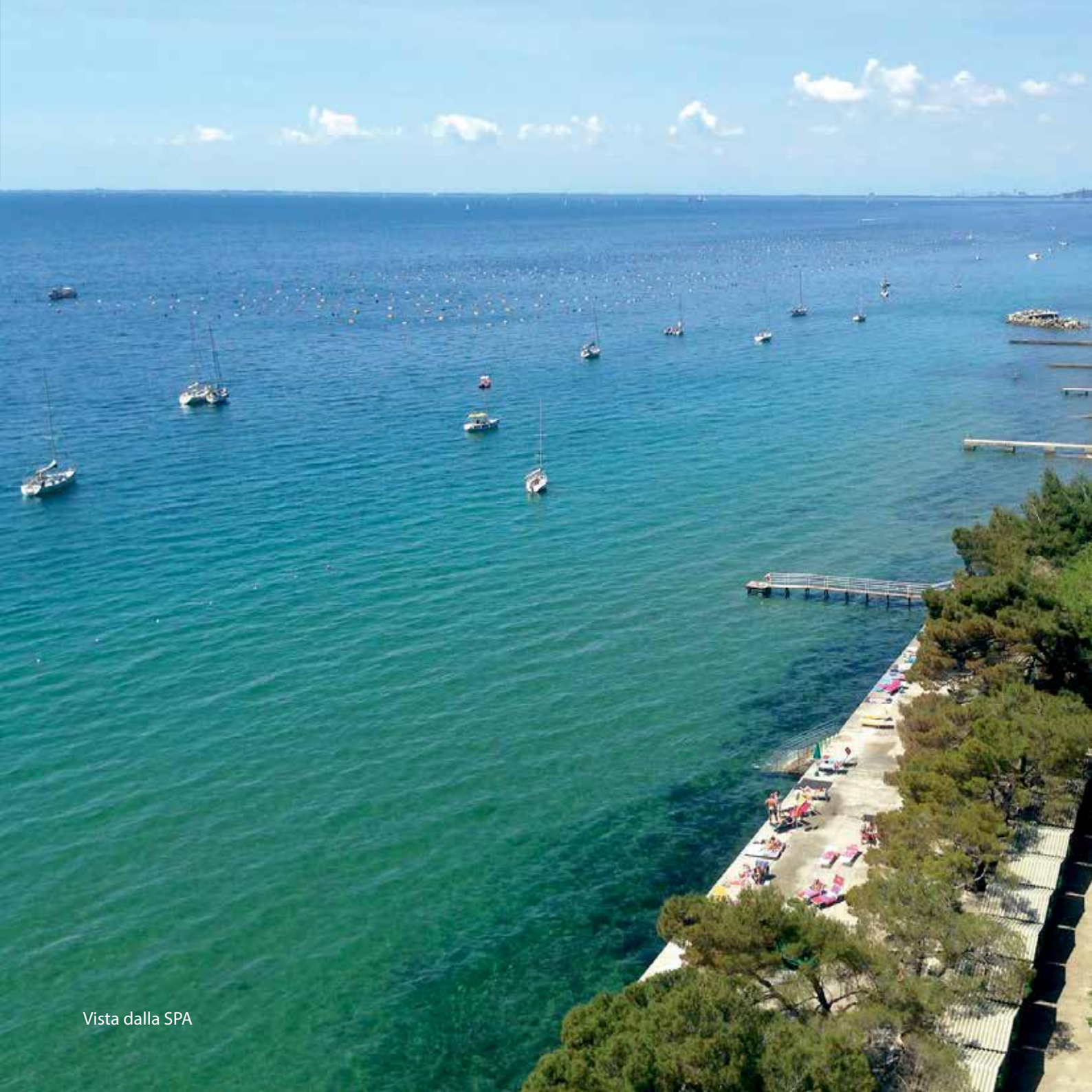
Vista dalla SPA